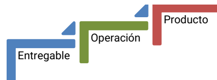
Figura 1. Esquema Bottom up

Fuente. Departamento de Planificación y Desarrollo, Estructura POA 2022.