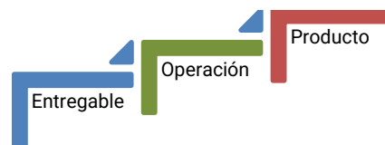
Figura 1. Esquema Bottom up

Fuente. Departamento de Planificación y Desarrollo, Estructura POA 2022.