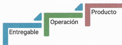
Figura 1. Esquema Bottom up

Fuente. Departamento de Planificación y Desarrollo, Estructura POA 2021.