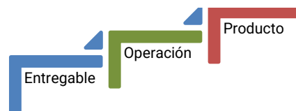
Figura 1. Esquema Bottom up

Fuente. Departamento de Planificación y Desarrollo, Estructura POA 2021.