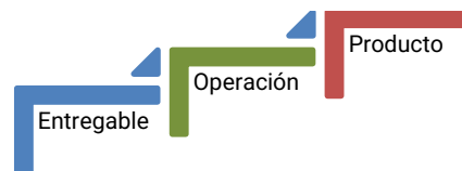
Figura 1. Esquema Bottom up

Fuente. Departamento de Planificación y Desarrollo, Estructura POA 2023.