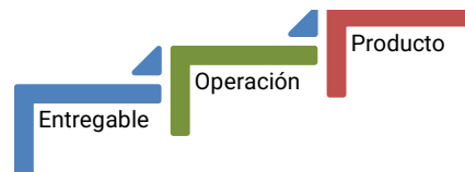
Figura 1. Esquema Bottom up

Fuente. Departamento de Planificación y Desarrollo, Estructura POA 2022.