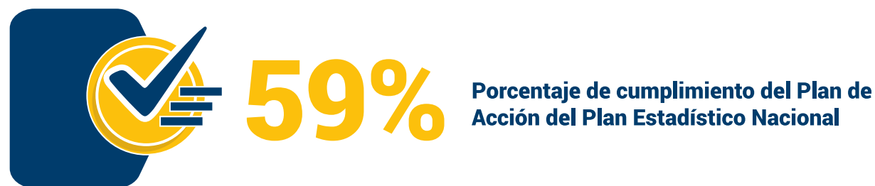
ILUSTRACIÓN 1. República Dominicana: Porcentaje de cumplimiento del Plan de Acción del Plan Estadístico Nacional, 2021-2024

Fuente: Elaborado a partir del Instrumento de Seguimiento y Monitoreo en la Implementación del Plan de Acción del Plan Estadístico Nacional (PEN).