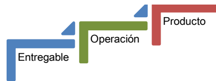
Figura 1. Esquema Bottom up

Fuente. Departamento de Planificación y Desarrollo, Estructura POA 2024.