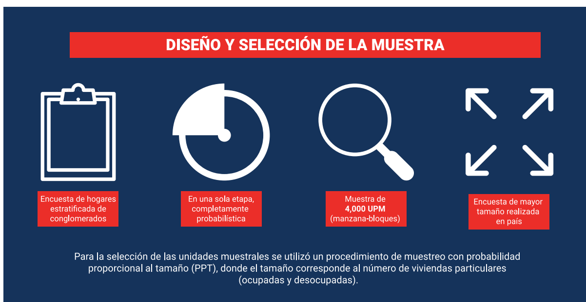
Figura 1: Aspectos metodológicos para el diseño y selección de la muestra de la Encuesta de cobertura y calidad (ECC) del X Censo Nacional de Población y Vivienda 2022.

Además, fueron parte de la metodología utilizada el análisis comparativo con otras fuentes tales como el IX Censo Nacional de Población y Vivienda, estimaciones demográficas, imágenes satelitales y registros administrativos.