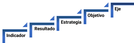
Figura 1. Esquema Bottom up