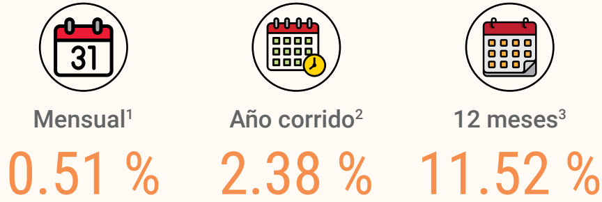
REGIÓN METROPOLITANA: Índice de Costos Directos de la Construcción de Viviendas, de febrero del 2021 a marzo del 2022