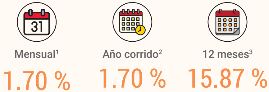
REGIÓN METROPOLITANA: Índice de Costos Directos de la Construcción de Viviendas, de diciembre del 2021 a enero del 2022