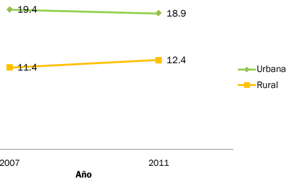
Gráfico 1 REPÚBLICA DOMINICANA: Porcentaje de hogares que recibió remesas desde el extranjero, por zona de residencia, 2007 y 2011