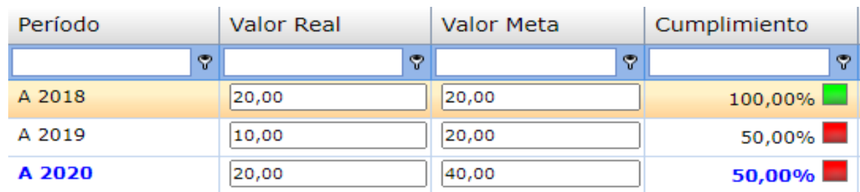
Tabla 4. Reporte de avance de producto “X Censo Nacional de Población y Vivienda realizado” al 31 de diciembre 2020.

Fuente: Sistema informático de seguimiento y evaluación – DELPHOS, ONE