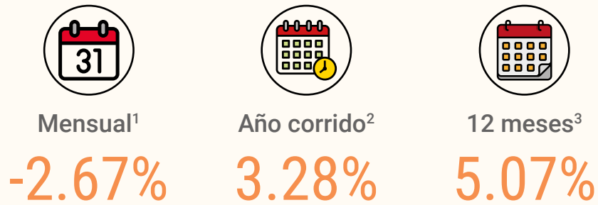
REGIÓN METROPOLITANA: Índice de Costos Directos de la Construcción de Viviendas, de julio del 2023 a agosto R del 2024